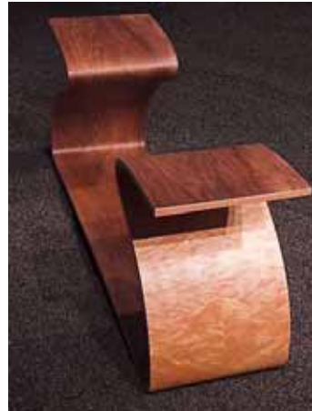
Nussbaum / Eisbirke

Exklusivität, durch kleine Stückzahl einer limitierten, nummerierten Edition