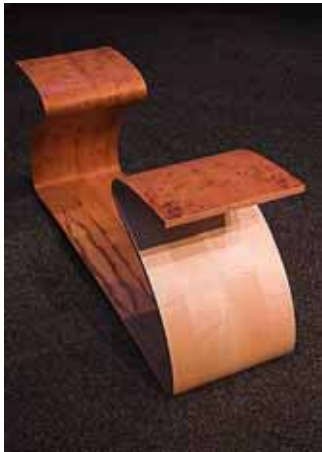
Eibe / Riegelahorn